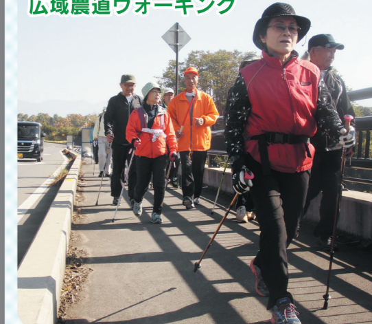
広域農道ウォーキング