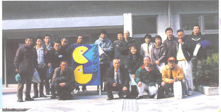
かほく市のクラブレッツ視察