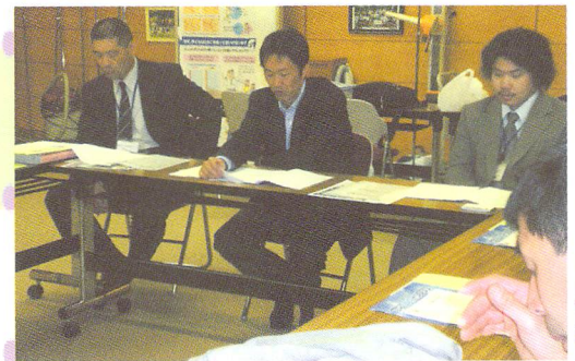
さなだスポーツクラブでの研修

都市内分権という行財政改革の動きの中、豊野地域でも「住民自治協議会準備会」が設立されました。住民の力でできることは住民自身がやる方向に自治は変わっていく傾向ですので、スポーツ分野の推進母体を創設する私たちの取り組みも時宜にかなったことだと思います。多くの皆さんの参加によってしっかりした組織にいただき、みんなの力で地域のスポーツを振興し、町の活性化にも役立てられれば幸いです。