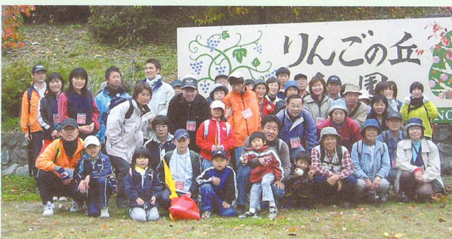
りんご狩りウォーキング（共催事業）