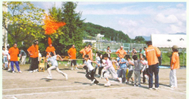
町民運動会（共催事業）