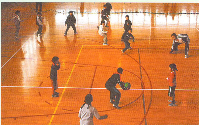
小学生ドッジボール大会（イベント）