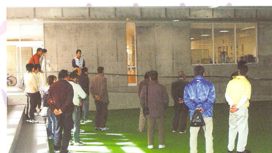
クラブレッツでの研修

【NPO 法人クラブレッツ】は金沢市に隣接する3つの町が合併したかほく市の宇ノ気町にある4年目になるクラブです。昨年新築の中学校と社会体育館を兼ねた宇ノ気体育センターの指定管理者になって、玄関ホールにオープン事務室を構え3人の常勤職員の他に数人のボランティアによって運営しています。2,000万円を超える予算規模で、パソコンや英会話等も含め40以上の教室とハイキング・学習指導もする夏休みこどもセミナー・中学校の文化祭への参加・フリーマーケット等ユニークなイベントもやっています。