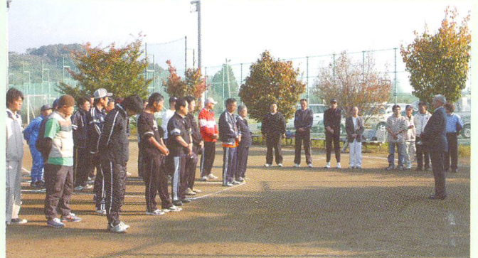
ソフトボール大会（イベント）