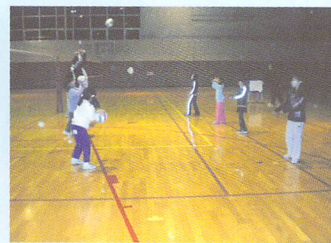
バレーボール教室