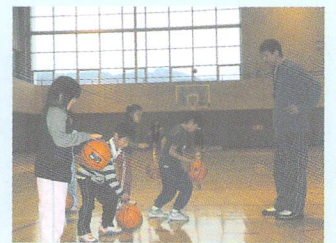
ミニバスケットボール教室