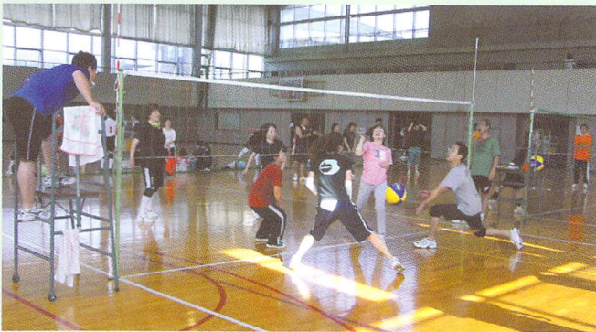
りんご杯ソフトバレーボール大会（イベント）