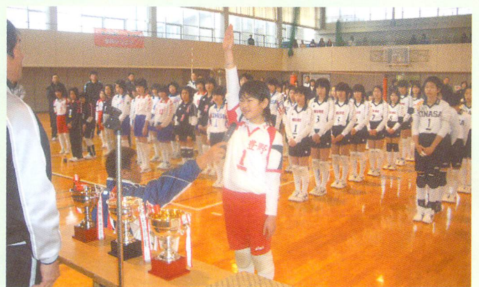
ニューイヤークップ（共催事業）