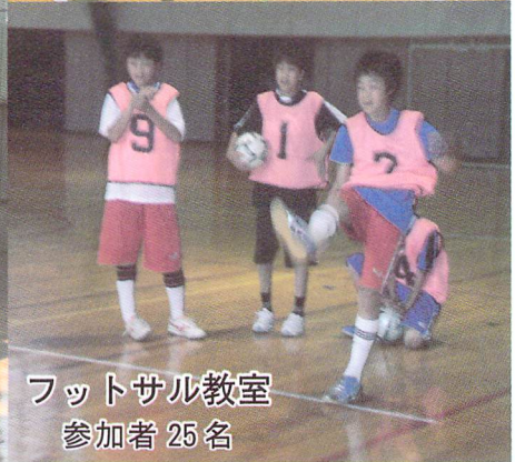
フットサル教室 参加者 25名