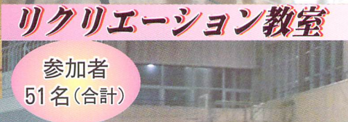
リクリエーション教室 参加者 51名(合計)