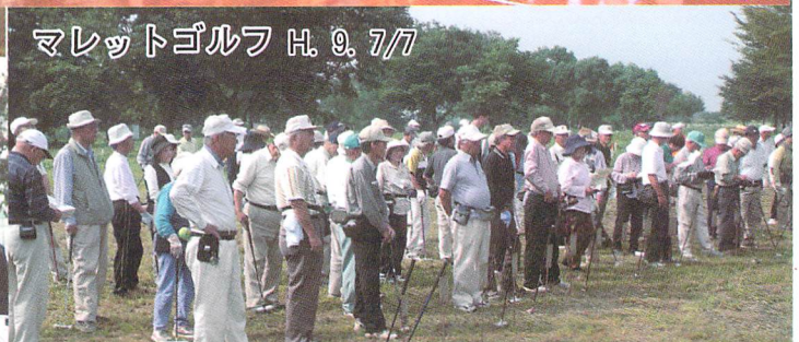
マレットゴルフ H. 9. 7/7