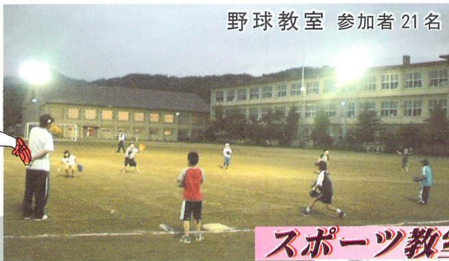
野球教室 参加者 21名