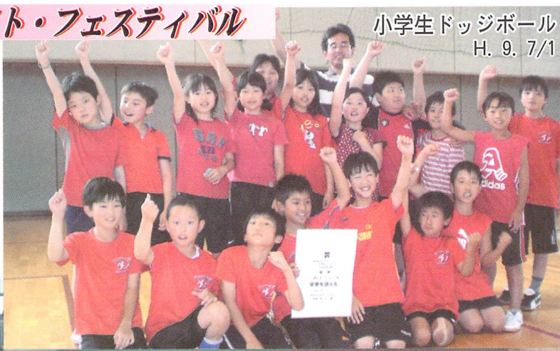
小学生ドッジボール H. 9. 7/1