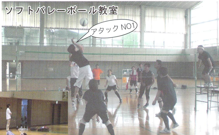
ソフトバレーボール教室