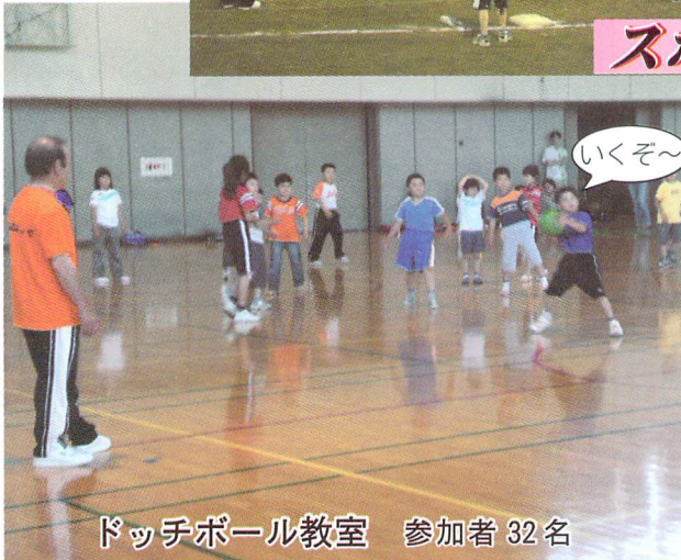
ドッチボール教室 参加者 32名