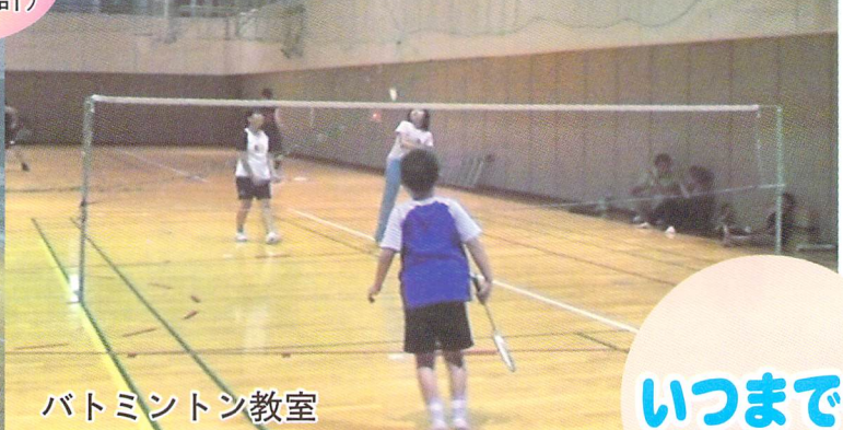
バドミントン教室