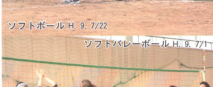
ソフトバレーボール H. 9. 7/1