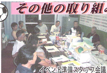
イベント準備スタッフ会議