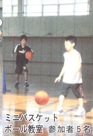
ミニバスケット ボール教室 参加者 5名