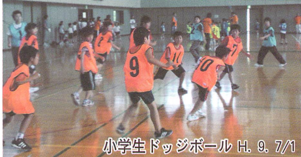
小学生ドッジボール H. 9. 7/1