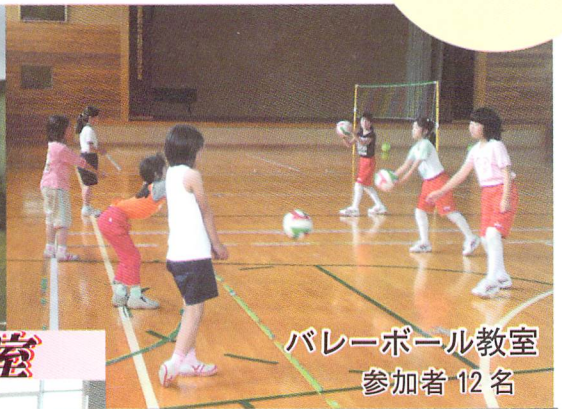
バレーボール教室 参加者 12名